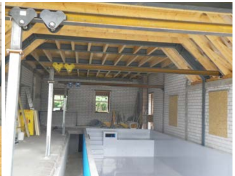
Eine Blockbohlensauna gehört ebenfalls zur Ausstattung. Die markante Decke soll den Himmel und die Verbundenheit zur Natur symbolisieren. Untere Reihe: Die Einbringung des Beckens in die Scheune war ein Kraftakt. Der Pool wurde nicht von oben herabgelassen, sondern seitlich eingeschoben.